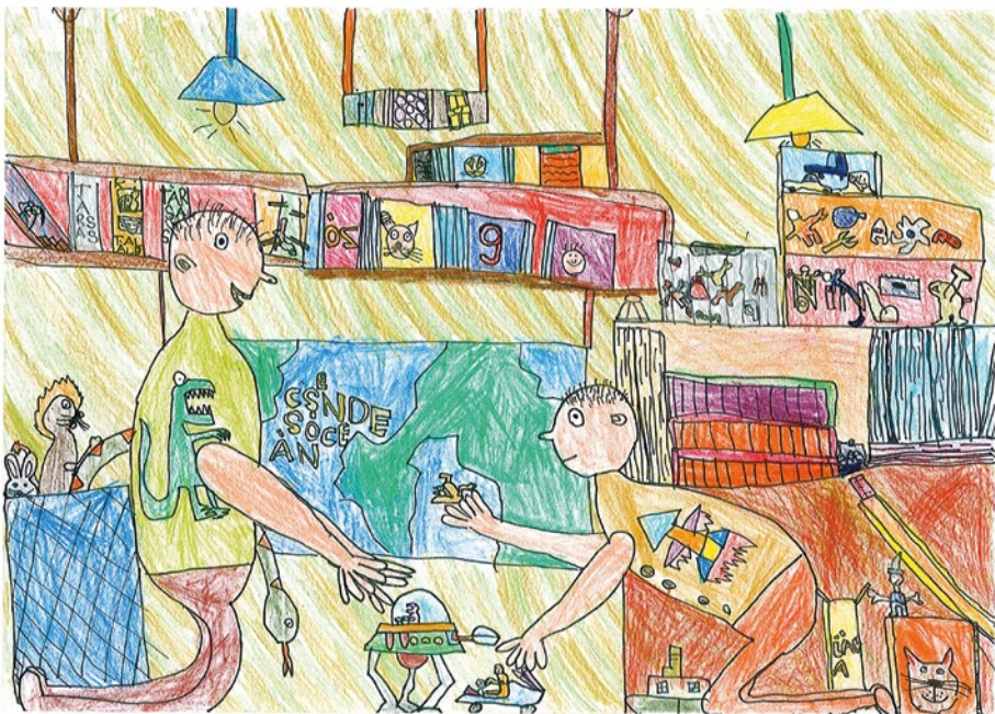
Szarka Dömötör, 7 éves: A testvérem és én