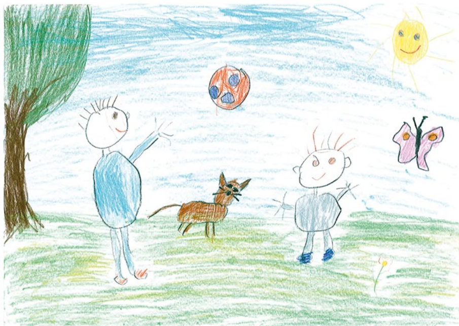
Győri Máttyás, 5 éves: Bátyóval labdázunk