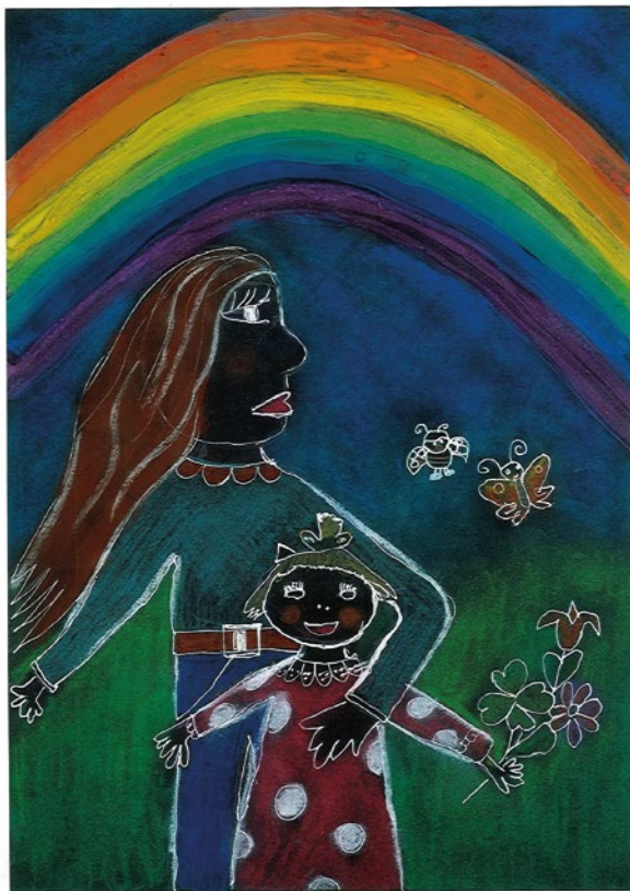
Herpay Zóra Réka, 6 éves: Abigél, életem legszebb ajándéka